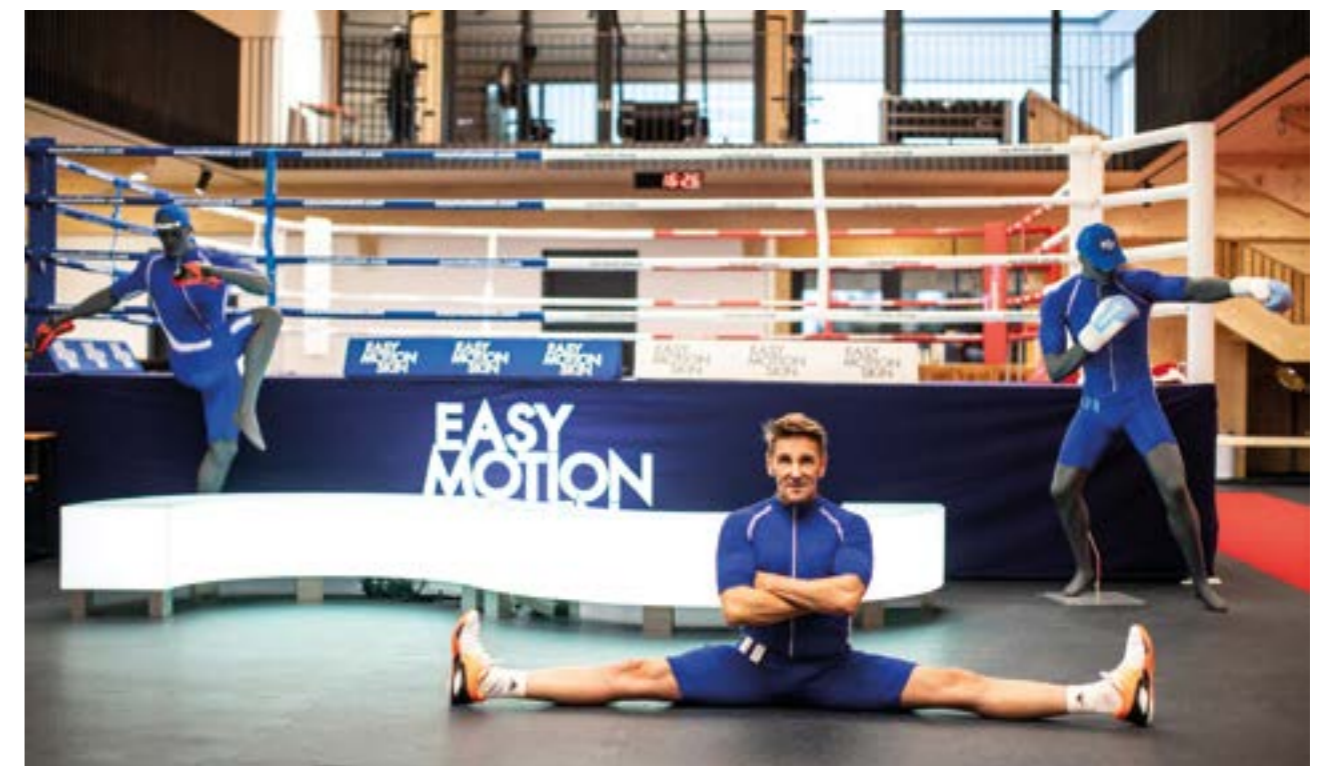
Schauspieler Mark Keller hält sich fit mit EasyMotionSkin – hier beim Training im EasyMotionSkin DOME