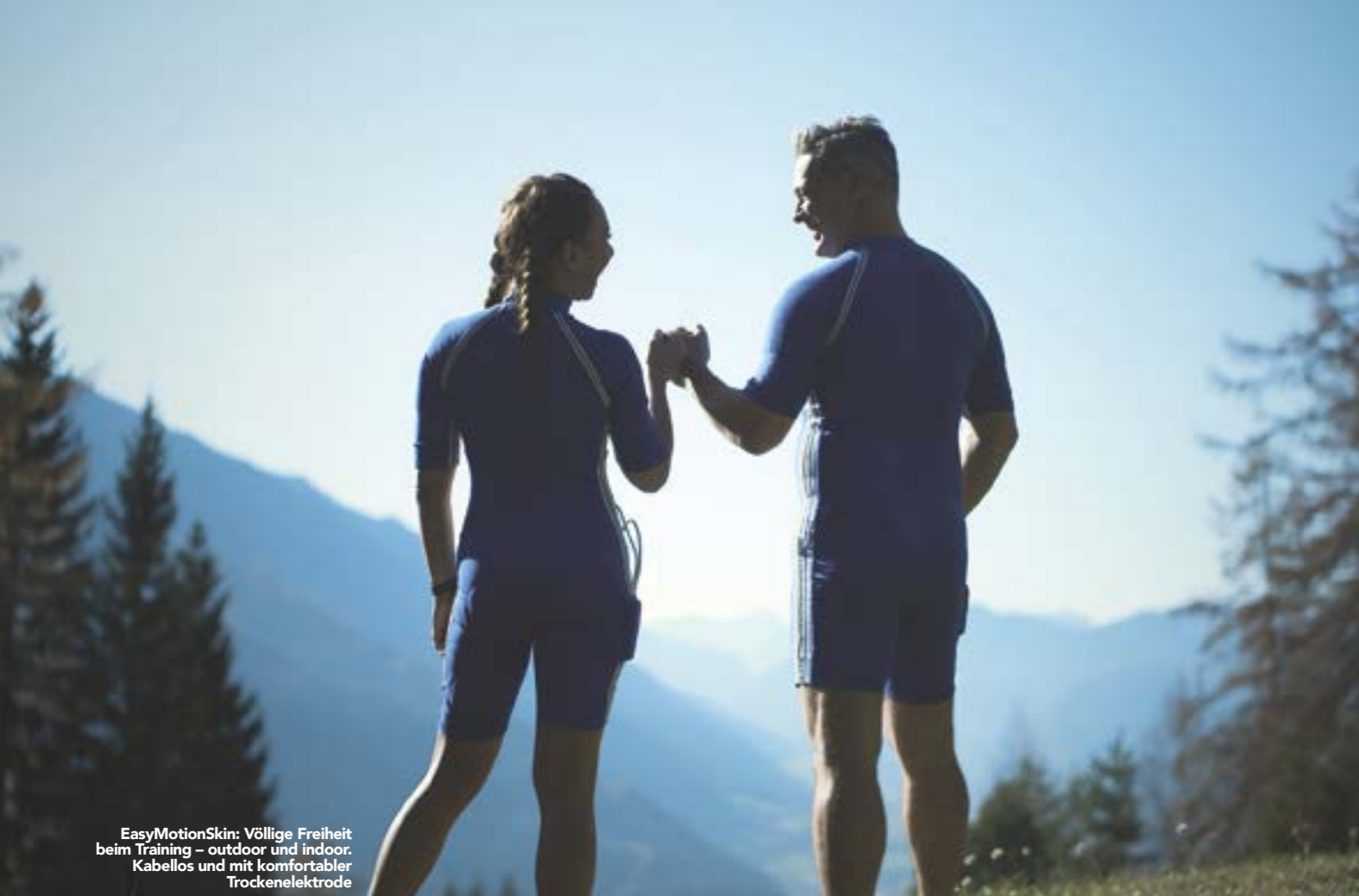
EasyMotionSkin: Völlige Freiheit beim Training – outdoor und indoor. Kabellos und mit komfortabler Trockenelektrode